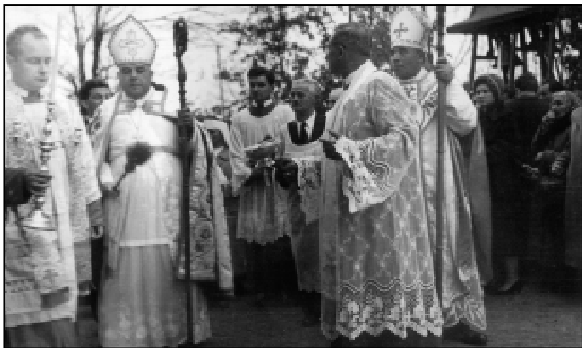
Poświęcenie dzwonów 1960 r.

w 1997 roku Kościół Starokatolicki Mariawitów uzyskał w drodze ustawy prawo wieczystego użytkowania tego gruntu. Nie była to jedyna strata poniesiona przez warszawską społeczność mariawitów tuż po wojnie.