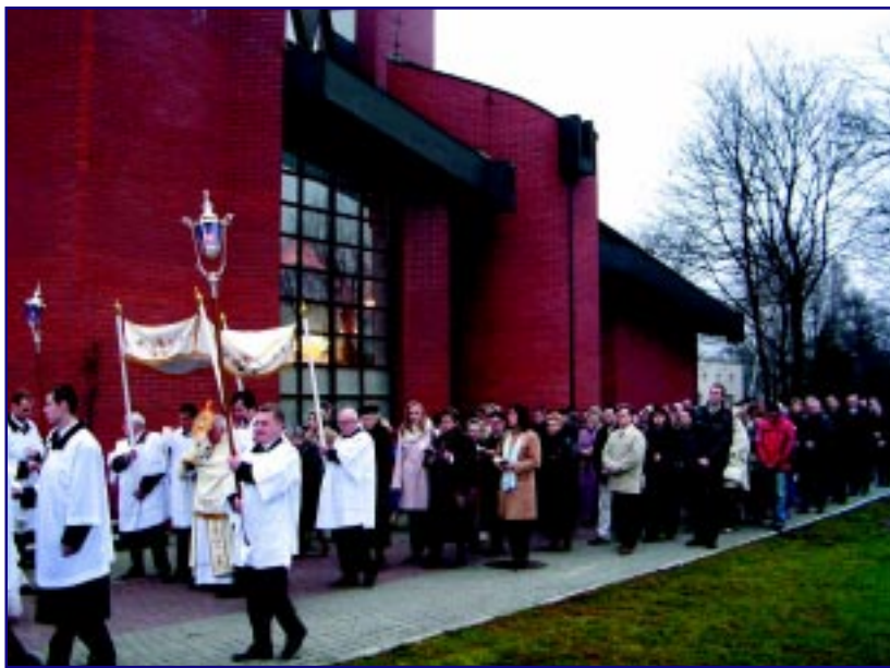
Procesja wokół kościoła

Parafialna reprezentowana przez proboszcza. Radę Parafialną wybiera zebranie parafialne na okres siedmiu lat.