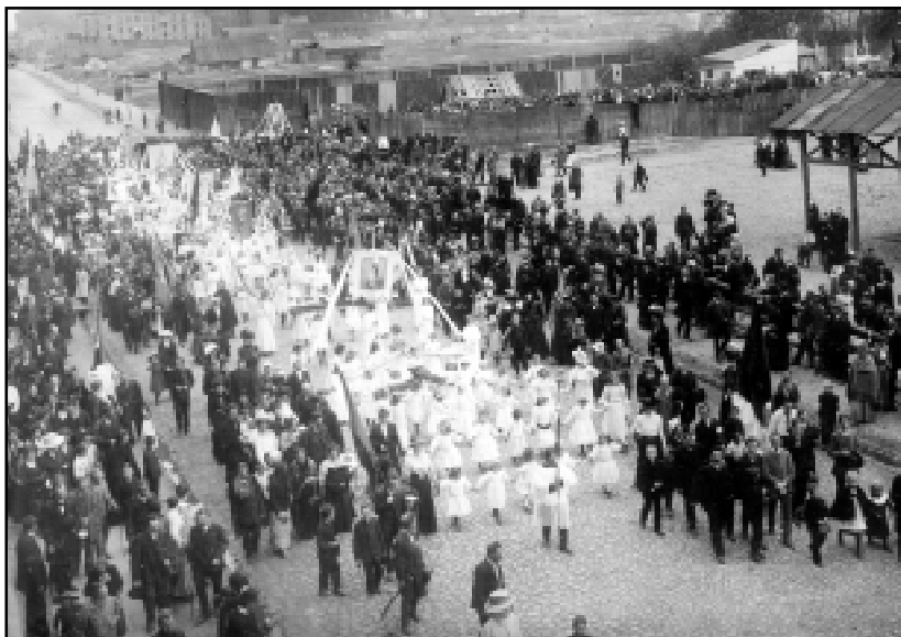
Procesja podczas Bożego Ciała, ul. Karolkowa. 1911 r.