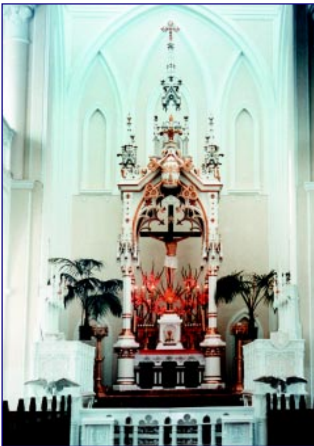
Altarz w Świątyni Miłosierdzia i Miłości w Płocku