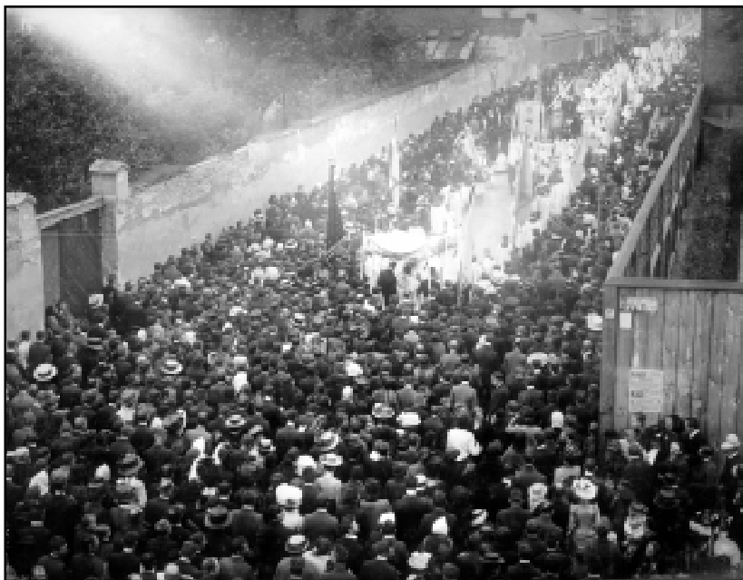
Wierni podczas procesji Bożego Ciała, ul. Szara. 1913 r.