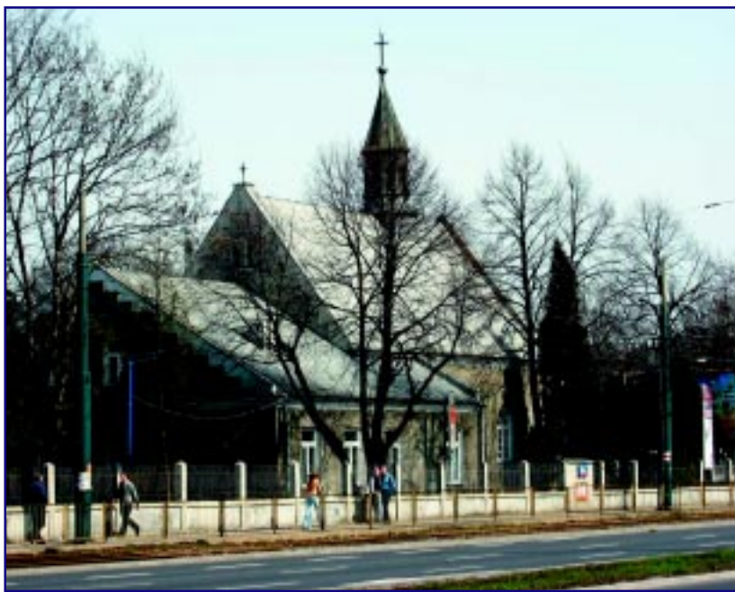
Kościół z plebanią przy ul. Wolskiej 186, użytkowany do 1997 r.