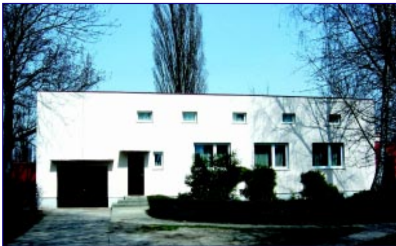
Budynek katechetyczny wzniesiony w latach 1983 – 1984