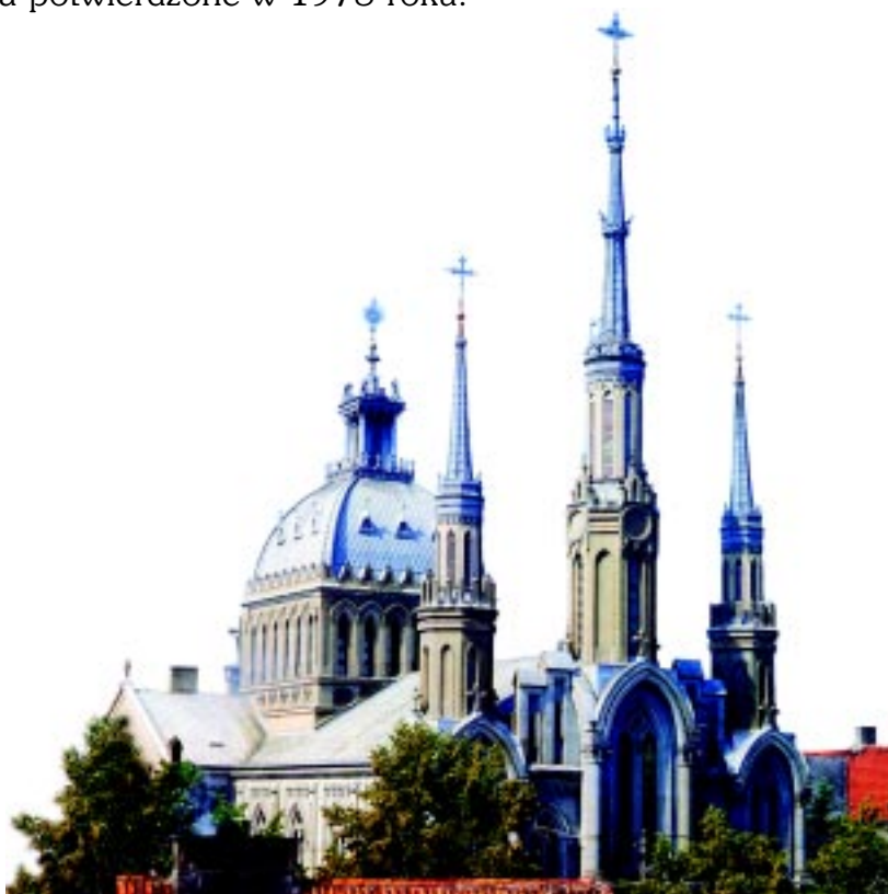
Świątynia Miłosierdzia i Miłości w Płocku