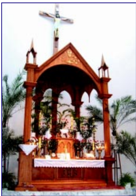
Ółtarz w nowym kościele w Warszawie